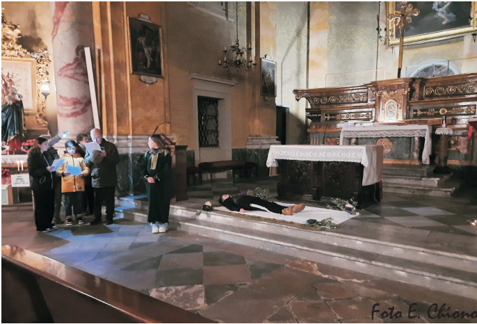
Via Crucis con i bambini del catechismo

La Quaresima ha avuto inizio in un giorno iconico per altri motivi, ovvero il 14 febbraio, giorno tradizionalmente dedicato a San Valentino e a tutti gli innamorati, che sicuramente ha avuto una rilevanza mediatica e di marketing superiore al Mercoledì delle Ceneri. In questo giorno la Chiesa prescrive ai fedeli digiuno e astinenza dalle carni, due pie pratiche che però non hanno da essere fini a se stesse; il ridurre per un giorno il cibo, che abbiamo la fortuna di avere ancora in molti sulle nostre tavole, deve essere lo spunto per riflettere su cosa significhi invece non avere nulla o molto poco da mettere nei piatti, ma anche – aggiungerei – su come “trattiamo” il cibo, che spesso finisce in quantità ingente nei rifiuti. Personalmente è una cosa che mi fa orrore: lavoro in una scuola – come sapete – e stimo che mensilmente finiscano nell'immondizia tra le 800 e le 1.000 pagnotte di pane (senza contare il resto dei pasti). Gesù ha fatto del Pane e del Vino il Suo Corpo e il Suo Sangue e noi invece dimostriamo poca sensibilità verso prodotti che diamo per scontato avremo sempre a disposizione. Ma sarà davvero così?