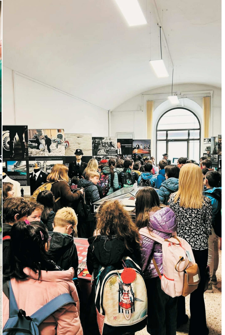
Visita alla Caserma Cernaia