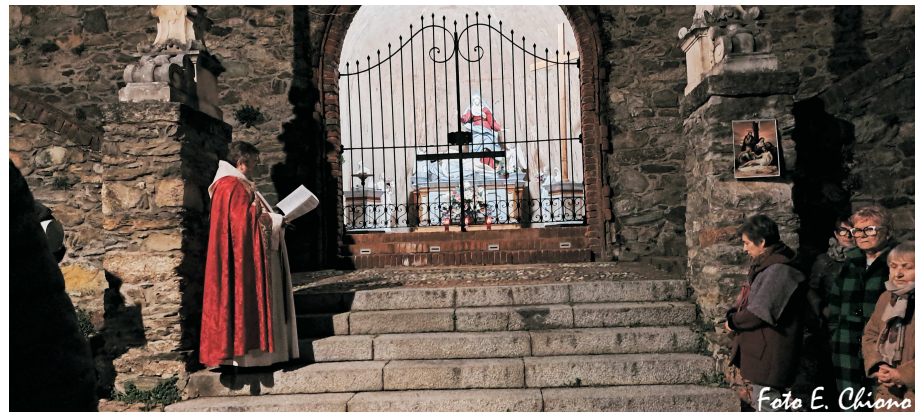
Via Crucis interparrocchiale a Cuceglio