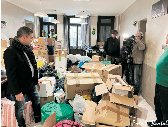
Missione Umanitaria in Ucraina