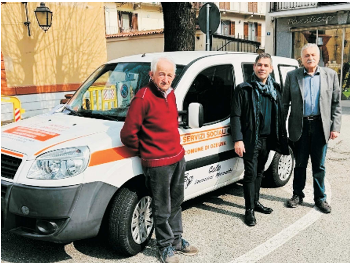
Servizio Trasporto Anziani